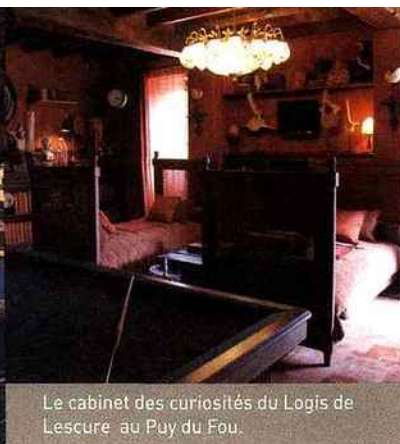
Le cabinet des curiosités du Logis de Lescure au Puy du Fou.